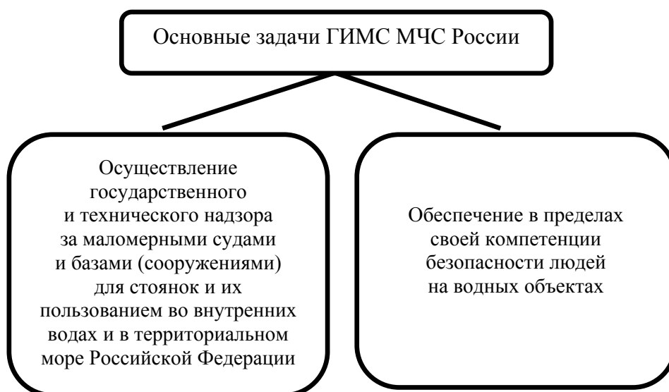
Рис. 1. Основные задачи ГИМС МЧС России

Что касается функций ГИМС МЧС России, то остались только надзорно-контрольные функции (функции, связанные с охраной жизни на водных объектах, исключены) (рис. 1).