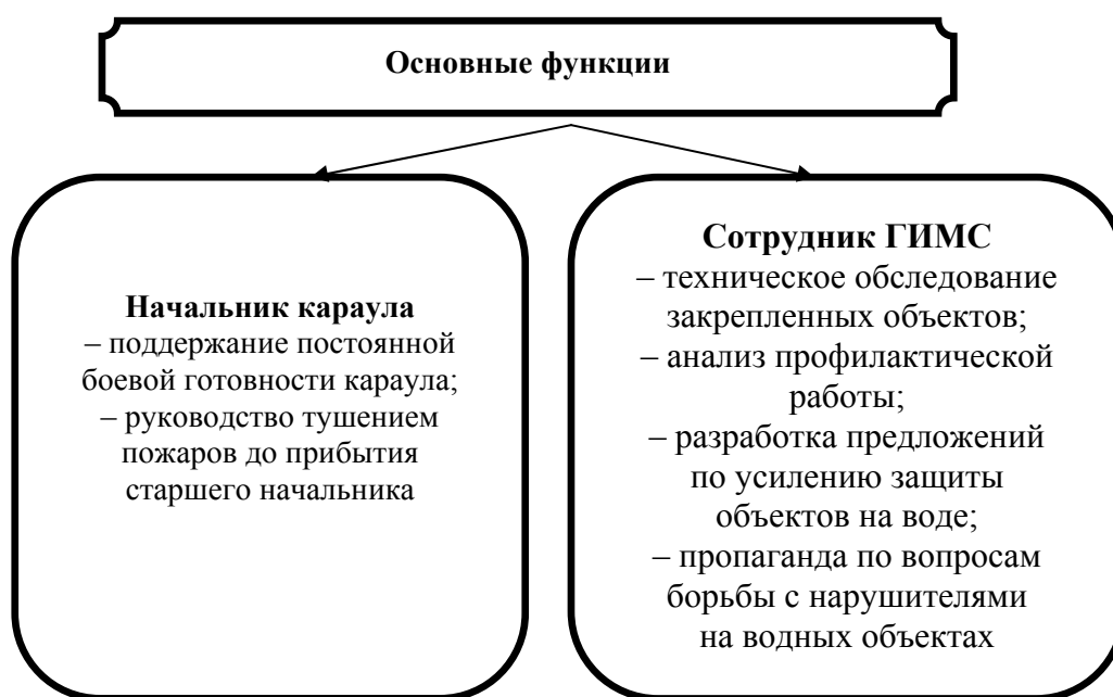
Рис. 2. Основные функции начальника караула и сотрудников ГИМС

Исходя из задач, различают их основные функции, содержание деятельности, ее условия, организацию и режим труда и многое другое.