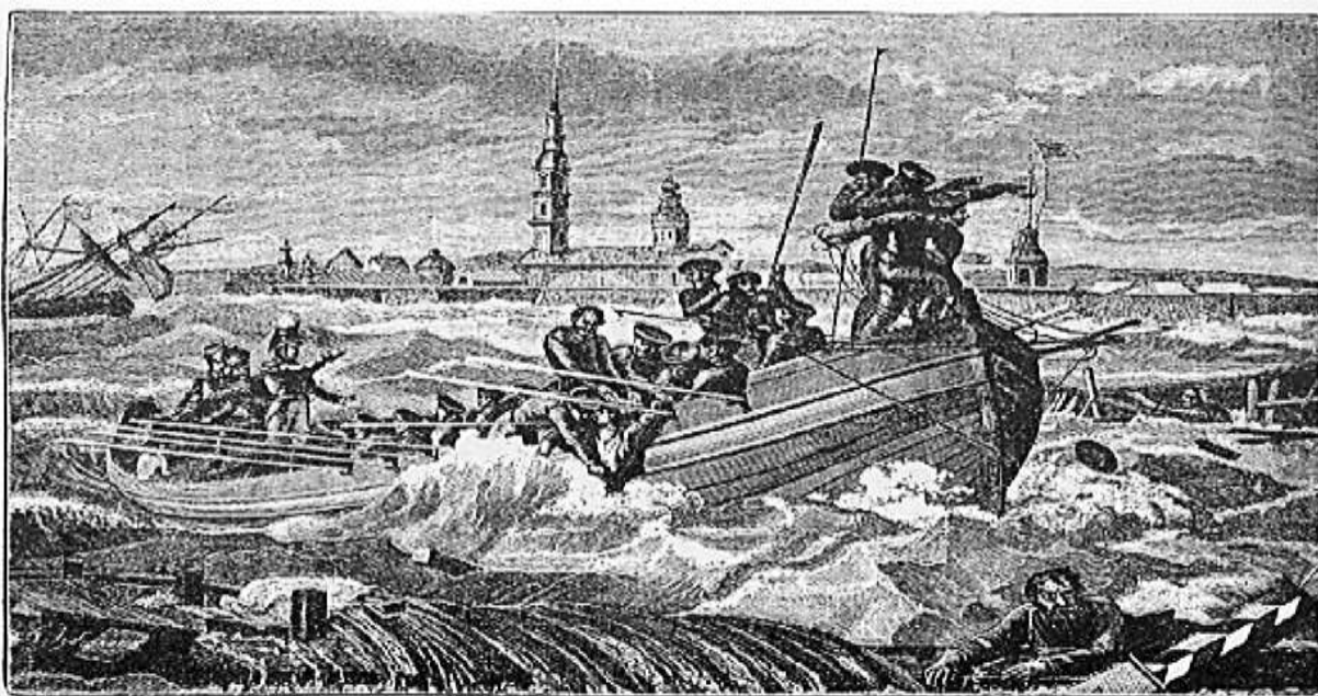
Наводнение в Петербурге 7-го ноября 1824 года. Съ сохраненной гравюры.

Тяготившийся административной рутинной, он лишь время от времени находил выход своей неукротимой энергии, регулярно появляясь на улицах столицы во главе отряда во время тушения пожаров. Во время катастрофического наводнения 1824 г. Милорадович принимал самое деятельное участие в спасении людей, о чем упоминает А.С. Пушкин в «Медном всаднике»: «...В опасный путь средь бурных вод Его пустились генералы спасать и страхом обуялый и дома тонущий народ» [6, 7].