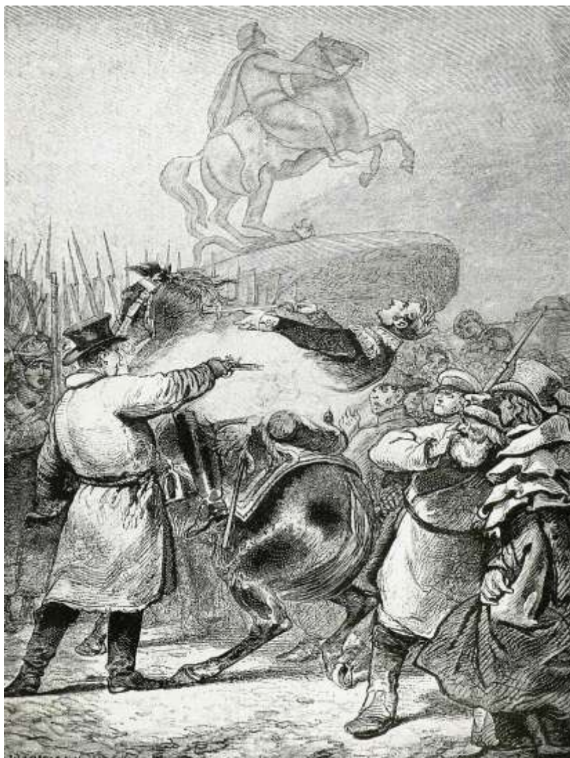
Генерал в 27 лет, участник 52 сражений, кавалер всех русских орденов и множества иностранных, «русский Баярд», так называли Милорадовича французы, то есть «рыцарь без страха и упрека», любимец армии был застрелен и заколот отставным и действующим офицерами

В результате счастливо избежавший ранений в более чем пятидесяти сражениях, герой Отечественной войны получил в тот день две раны от заговорщиков. Штыковую от Оболенского и пулевую от Каховского (выстрелом в спину или слева). Пулевое ранение оказалось смертельным.