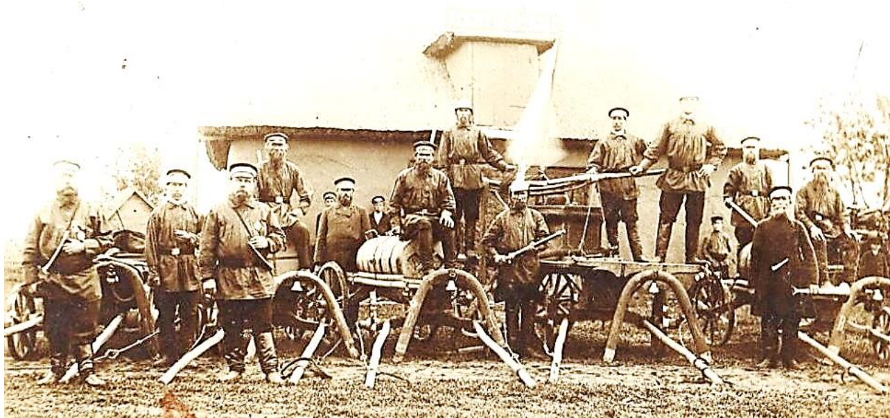
Рис. 1. Сельская добровольная пожарная дружина Владимирской губернии (1910 г.)

Пожарное добровольчество как форма общественной взаимопомощи получило распространение в России (в Российской Империи) в первой половине XIX в. К 1890 г. насчитывалось уже около 60 пожарных обществ, которые на съезде пожарных, состоявшемся 14–15 июня 1892 г., были объединены в Соединённое Российское пожарное общество, которое затем было переименовано в Императорское (ИРПО).