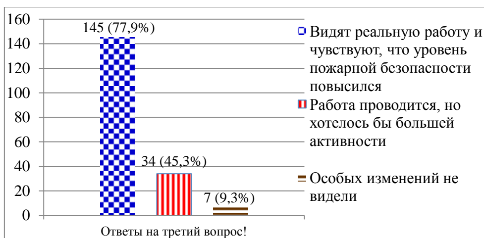
Рис. 4. Результаты ответа на вопрос: «Видна ли проводимая работа в области пожарной безопасности в сельских населенных пунктах Нижневартовского района с участием добровольных пожарных?»

Еще один вопрос: «Видна ли проводимая работа в области пожарной безопасности в сельских населенных пунктах Нижневартовского района с участием добровольных пожарных?» был задан проживающим в них гражданам. В опросе приняли участие 186 человек. Наибольшее количество 145 человек (77,9 %) ответило, что «видят реальную работу и чувствуют, что уровень пожарной безопасности повысился», следующим был ответ: «Работа проводится, но хотелось бы большей активности» – 34 человека (45,3 %), далее ответ: «Особых изменений не видели» выбрали 7 человек (9,3 %) (рис. 4).