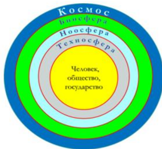
Рис. 2. Модель среды обитания человека

В целом это весь окружающий нас мир, который используется, изучается, трансформируется человеком в своих интересах, разрабатывая, строя и применяя все более сложные системы. По сути, техносферу можно рассматривать как материализацию идей и знаний, формирующих ноосферу. Тогда, с определенной долей условности, современное представление о среде обитания человека можно отразить в виде, представленном на рис. 2.