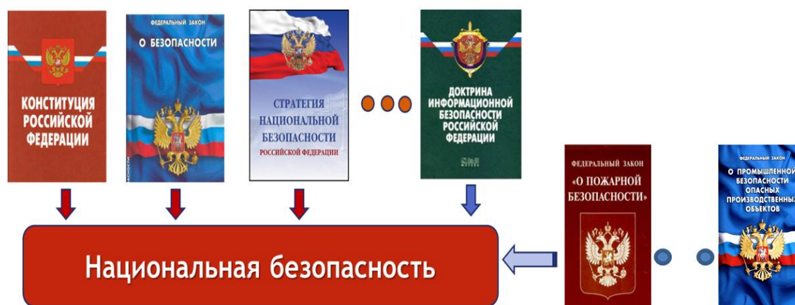
Рис. 3. Правовая основа обеспечения национальной безопасности Российской Федерации

Российской Федерации на период до 2030 года», Федеральный закон от 21 июля 1997 г. № 116-ФЗ «О промышленной безопасности опасных производственных объектов», Федеральный закон от 21 декабря 1994 г. № 69-ФЗ «О пожарной безопасности», Федеральный закон от 26 июля 2017 г. № 187-ФЗ «О безопасности критической информационной инфраструктуры Российской Федерации», Указ Президента Российской Федерации от 11 июля 2004 г. № 868 «Вопросы Министерства Российской Федерации по делам гражданской обороны, чрезвычайным ситуациям и ликвидации последствий стихийных бедствий») (рис. 3).