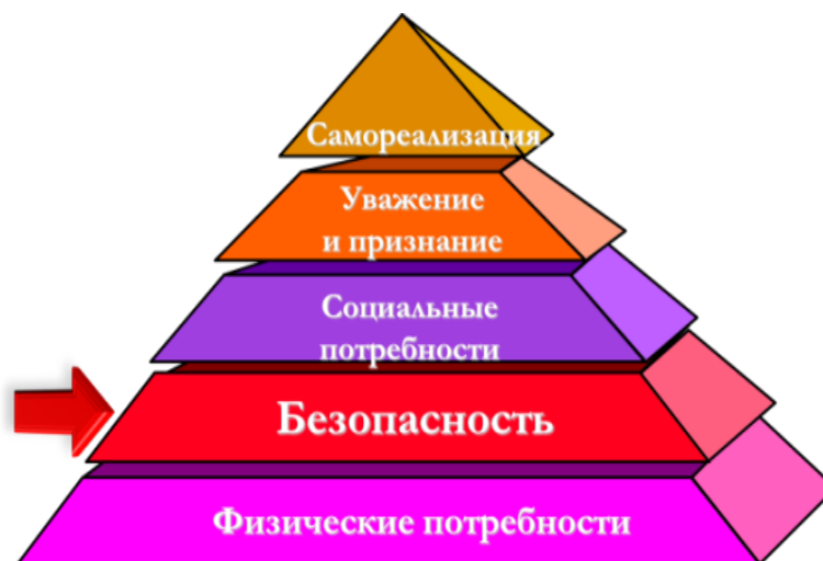
Рис. 1. Безопасность в пирамиде потребностей Маслоу

в безопасности, уступая только реализации жизненно необходимых основных физиологических желаний (еда, питье, кров, одежда, тепло, сон, секс), без которых человек вообще не может существовать. Когда физиологические потребности человека удовлетворены, на первый план выходит потребность в безопасности. В социуме это означает отсутствие прямых угроз жизни и здоровью, имуществу, защиту от природных, техногенных и социальных катаклизмов. Предложенная теория в дальнейшем получила свою наглядную и наиболее известную графическую модель иерархии потребностей человека в виде «пирамиды Маслоу (Maslow)», где перечень потребностей и их интерпретация могут варьироваться в различных источниках, но две первые, базовые потребности, остаются, и по формулировке, и по значимости неизменными (рис. 1) [2].