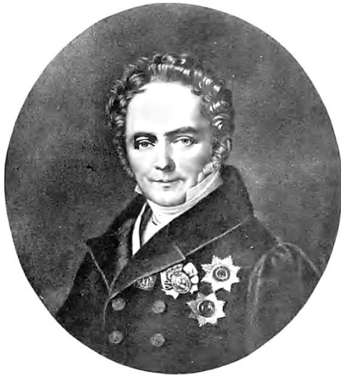
Министр Внутренних Делъ, Действительный Тайный Советникъ. Князь Викторъ Павловичъ Кочубей 1802—1807 г. и 1819—1823 г.