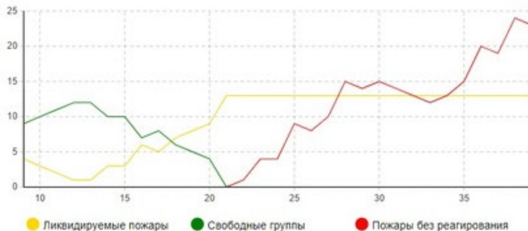
Рис. 2. График работы модели

При запуске модели (рис. 1) можно было заметить, что в блоке «ожидание_реагирования» накапливается очередь из появившихся пожаров. Это говорит о том, что для реагирования на пожар в данный момент модельного времени нет свободных групп, следовательно, данного количества групп в заданных условиях будет недостаточно для своевременного реагирования на вновь появляющиеся лесные пожары.