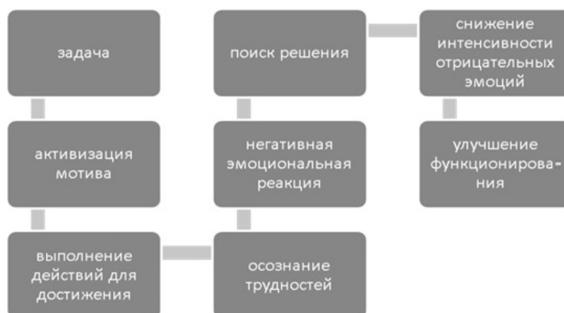
Рис. 3. Схема поведения личности с высокой психологической устойчивостью