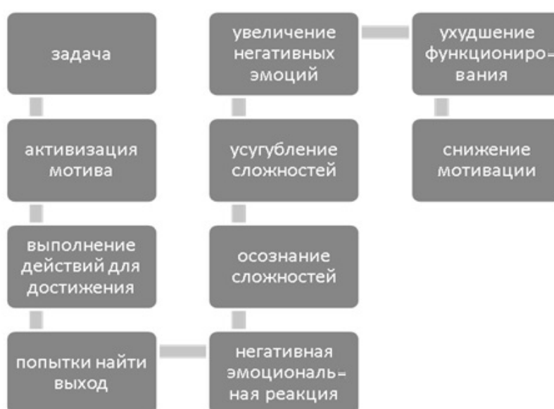
Рис. 4. Схема поведения личности с низкой психологической устойчивостью

Коррупция как социальное явление негативно сказывается на моральной и психологической устойчивости как отдельных лиц, так и групп. Эта устойчивость помогает сохранять внутреннее спокойствие и положительные отношения в трудных ситуациях.