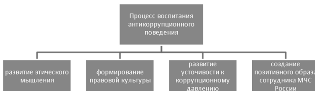
Рис. 2. Основные элементы процесса воспитания антикоррупционного поведения курсантов и студентов высших учебных заведений МЧС России

Из этого следует, что процесс воспитания антикоррупционного поведения курсантов и студентов высших учебных заведений МЧС России должен основываться на комплексном подходе, который включает несколько основных направлений (рис. 2).