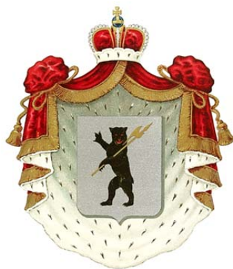
Рис. 2. Герб князей Троекуровых