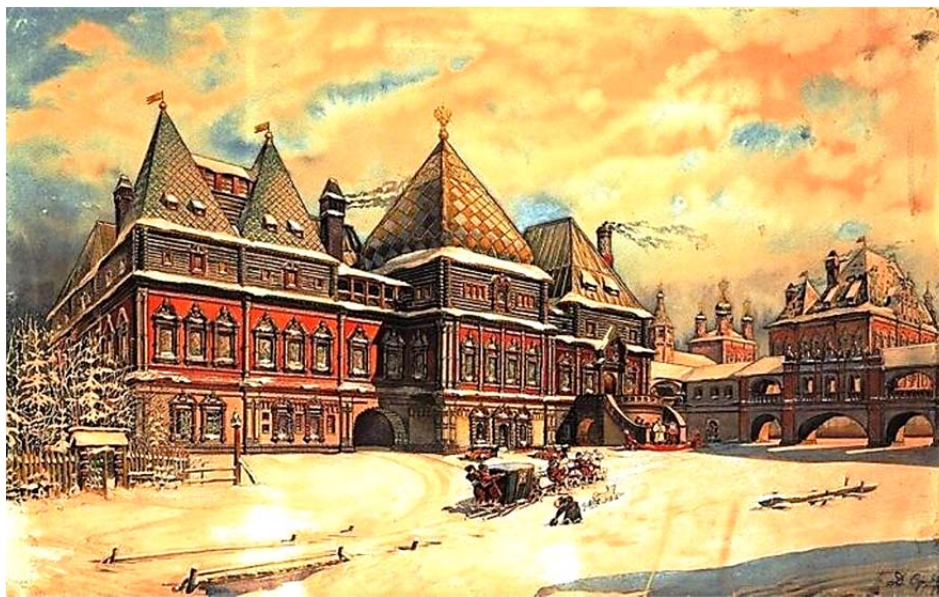
Рис. 3. Палаты Троекуровых 3

Недалеко от здания Госдумы в столице находится памятник русского зодчества – палаты Троекуровых. Построил их Иван Борисович Троекуров (рис. 3).