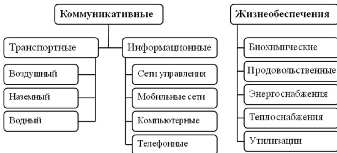
Рис. 2. Развитие угрозных факторов современности [2]

больше стран и народов. Кроме того, современное оружие на новых физических свойствах, управляемое с использованием искусственного интеллекта, все меньше поддается контролю со стороны его применяющих. В общих угрозах все больший вес приобретают новые коммуникативные угрозы и опасности в сфере жизнеобеспечения человека. Но если раньше данные угрозы и опасности имели место на отдельных, густонаселенных и высокоразвитых территориях, то с началом тысячелетия они распространились по всем странам и континентам (рис. 2).