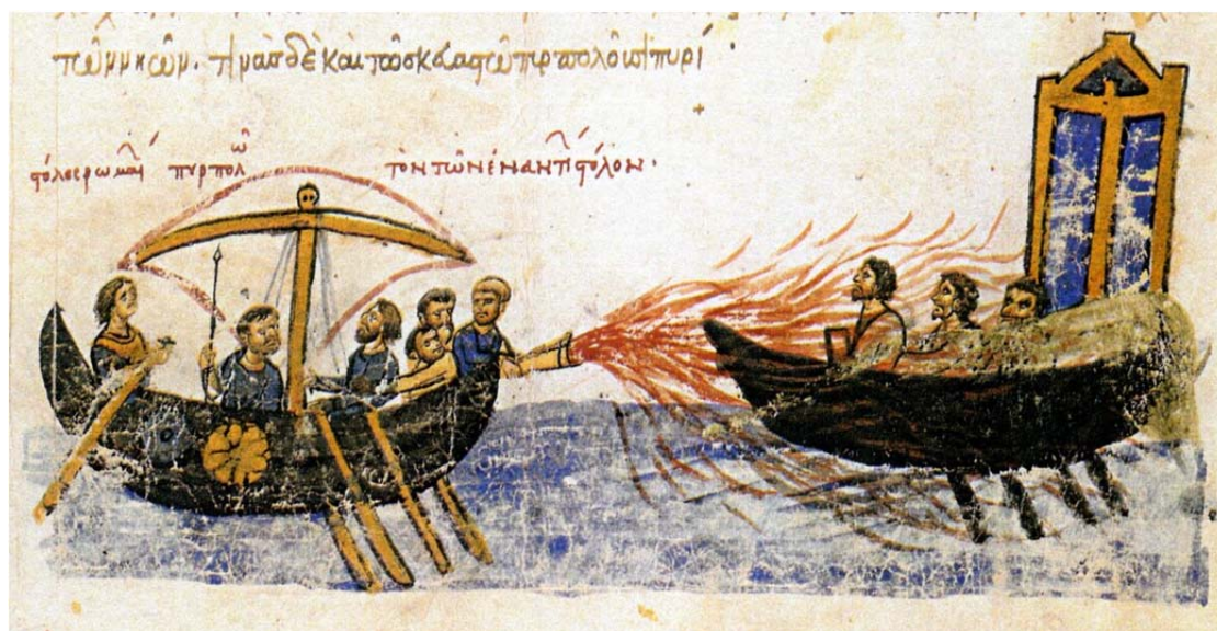
Рис. 2. Применение «греческого» огня. Миниатюра Мадридского списка «Хроники» Иоанна Скилицы. XIII в.

В емкость устройства заливалась горючая смесь нефти и специальных компонентов. Это устройство применял и Олег в сражениях с врагами Руси (рис. 2) [5].