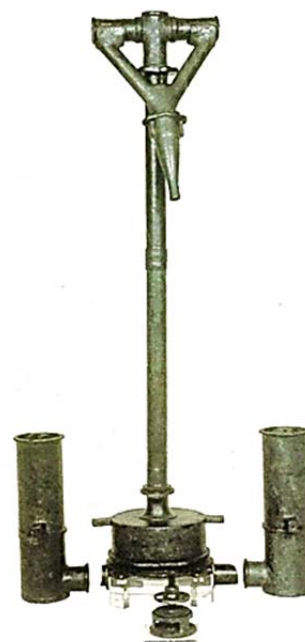
Рис. 1. Насос конструкции Ктесибия. Применялся в устройстве для подачи «греческого огня». Найден в Испании у г. Мадрида

В емкость устройства заливалась горючая смесь нефти и специальных компонентов. Это устройство применял и Олег в сражениях с врагами Руси (рис. 2) [5].