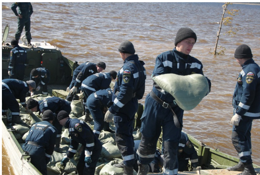
Рис. 2. Курсанты разгружают ПТС

За первые трое суток общее время выполненных работ курсантами НПС университета составило 44,5 ч. За это время разгружено 21 плавательное техническое средство (ПТС) и 8 КАМАЗов с песком, в общей сложности 76 тонн. Возведено 2,1 км заградительных сооружений из непромокаемого синтетического материала, при этом постоянно продолжалось удержание этой конструкции от размыва на всем ее протяжении (рис. 2).