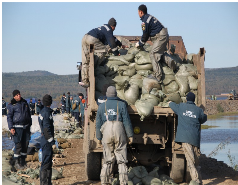
Рис. 4. Укрепление Мылкинской дамбы мешками с песком

За весь период личным составом были проделаны следующие виды работ: