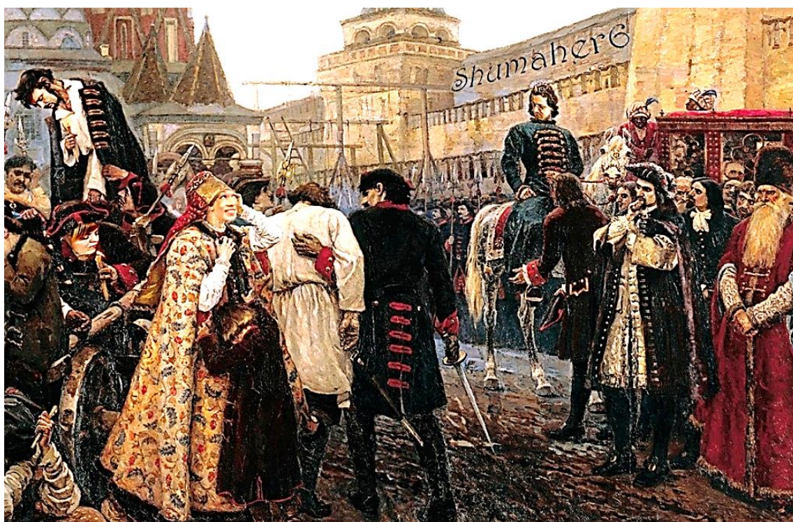
Василий Иванович Суриков. Утро стрелецкой казни. (Фрагмент) Крайний справа М.А. Черкасский

Самого Михаила Алегукевича мятежные стрельцы не тронули. Князь Михаила был «любимым народом». Влияние Черкасского при дворе тоже было чрезвычайно велико. Его опасался сам всеильный в ту пору фаворит царевны Софьи, регентши при малолетних братьях Иване и Петре, князь Василий Васильевич Голицин – в письмах из походов он постоянно напоминал Федору Шакловитому «смотреть недреманным оком на Черкасского». Смотрели, да еще как, и милостями осыпали, но не купили: черкесские понятия о чести не умерли в обрусевшем аристократе [1].