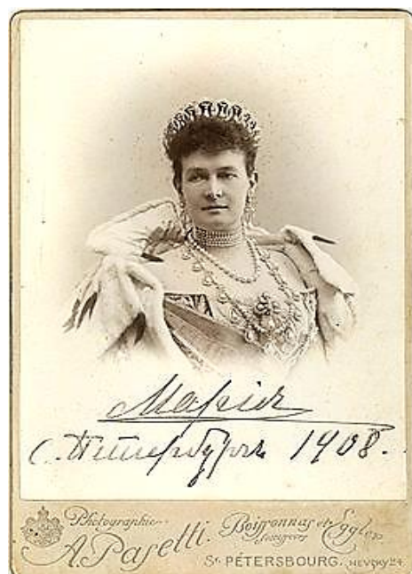
Рис.1. Третья Императрица

Она все же приняла православие чрез миропомазание 10 апреля 1908 г., незадолго до смерти мужа, о чём был дан Высочайший манифест, повелевавший «Именовать Ея Императорское Высочество Благоверною Великою Княгинею» [1].