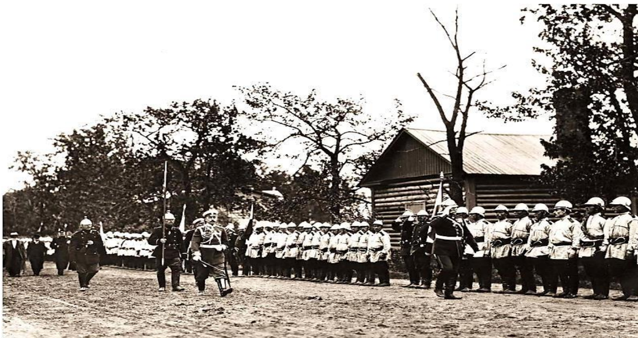
Смотр пожарной команды в Ульяновке

По всей местности, которую охраняла Ульяновская пожарная команда и ее дружина, с целью оповещения была введена телефонная линия. Работала проволочная линия сигнальных аппаратов протяженностью 250 верст. На каланче здания Ульяновской команды поднимались сигнальные флаги, так «по пожару № 4 вывешивался красный, а по № 5 – зеленый флаг». Район выезда был разделен на восемь участков, по которым вывешивались сигналы, состоявшие из черного шара и флага – красного, синего, желтого или зеленого, в зависимости от района выезда. По нечетным районам флаг вывешивается под шаром, а по четным над ним». Ночью флаги заменяли соответствующего цвета фонари.