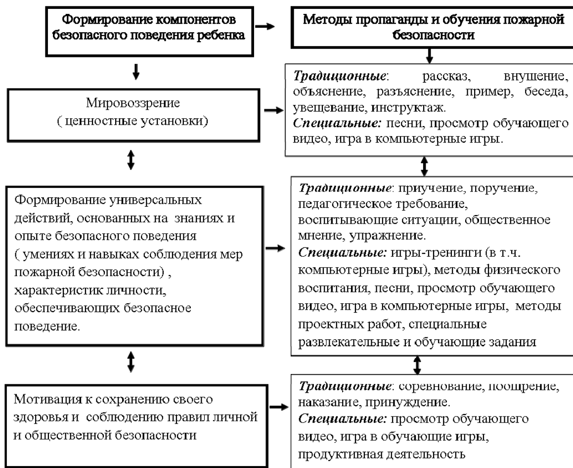
Рис. 1. Методы формирования безопасного поведения ребенка в процессе пропаганды и обучения пожарной безопасности, определенные в ходе опытно-экспериментальной деятельности на базе образовательных организаций