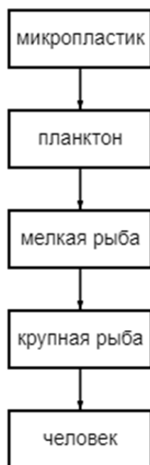
Рис. 3. Пищевая цепочка в водной среде

Планктон является основой морской пищевой цепи, следовательно, его поглощают все морские обитатели, которых после потребляет и человек.