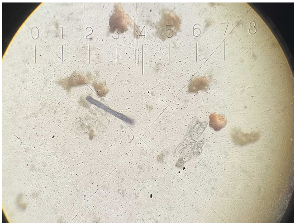
Рис. 2. Частица микропластика волокнистой формы синего цвета в пробе донных отложений Ладожского озера 2022 г.

Первичный микропластик представляет собой частицы (микрогранулы) с определенными параметрами, которые производятся для добавления в различную продукцию. Они широко используются при производстве косметических средств, например, косметика с добавлением блесток или зубные пасты с абразивными частицами, использующиеся для отбеливания зубов и бытовой химии, в стиральных порошках для лучшего удаления пятен, в промышленности могут быть использованы как абразивы, применяемые для очистки загрязненных поверхностей зданий или технических средств, например, кораблей, также микрогранулы активно используются в 3D принтерах [1, 4].