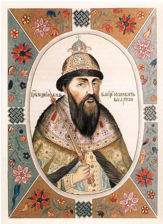
Василий Шуйский (Портрет из Царского титулярника 1672 г.)

Князя Шуйские – особая ветвь «Рюриковичей», ведущая свою родословную от князя Андрея Ярославича, младшего брата Александра Невского. Род Василия Ивановича Шуйского, (от Рюрика колена XXIV), происходит от князя Юрия Васильевича, получившего в удел городок Шую с окрестностями. В результате удельный князь Юрий Васильевич получил прозвище «Шуйский», которое и закрепилось за его потомством, как фамилия [1, 2].