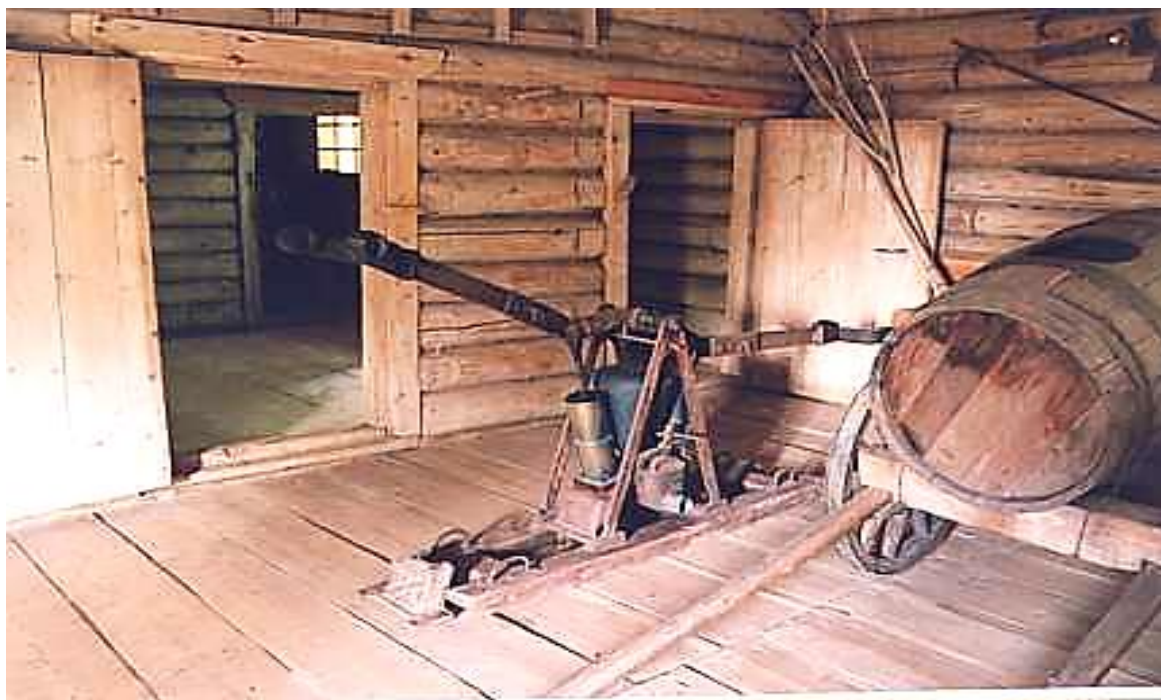
Рис. 1. Пожарный обоз XVII в. [9]