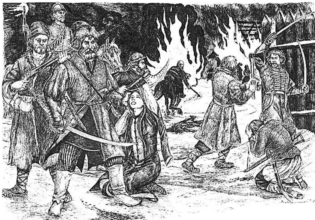
Рис. 3. Пожар Москвы 1611 г. в результате сражения поляков и литовцев с жителями Москвы [10]

«Тут, в час решительный, услышали голос: «огня! огня!» – и первый вспыхнул в Белом городе дом Михаила Салтыкова, зажженный собственной рукою хозяина: гнусный изменник уже не мог иметь жилища в столице отечества, им преданного иноплеменнику! Зажгли и в других местах: сильный ветер раздувал пламя в лицо Москвитянам, с густым дымом, несносным жаром, в улицах тесных. Многие кинулись тушить, спасти дома; битва ослабела, и ночь прекратила ее, к счастью изнуренного неприятеля, который удержался в Китае-городе, опираясь на Кремль. Там все затихло; но другие части Москвы представляли шумное смятение. Белый город пылал; набат гремел без умолку; жители с воплем гасили огонь, или бегали, искали, кликали жен и детей, забытых в часы жаркого боя. После такого дня, и предвидя такой же, никто не думал успокоиться...» [10].