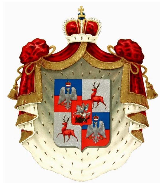
Родовой герб Шуйских