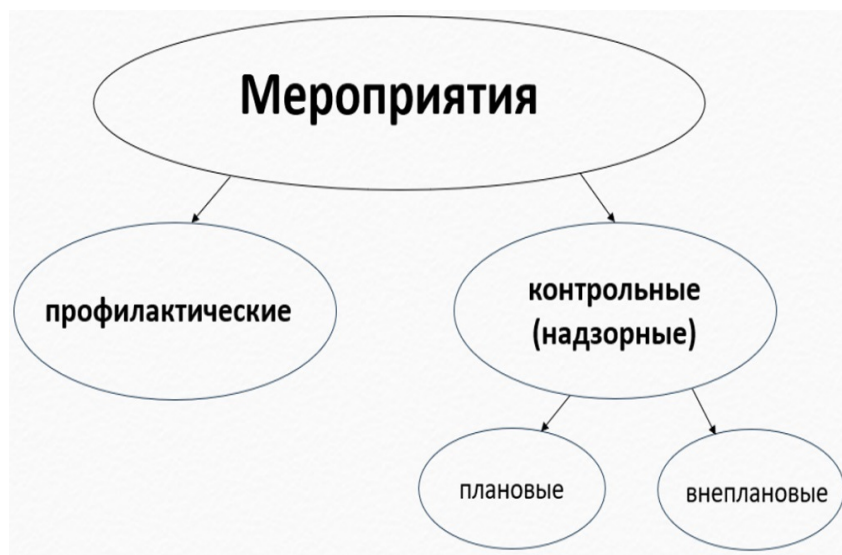
Рис. 1. Схема мероприятий, проводимых надзорными органами

На сегодняшний день контрольные (надзорные) мероприятия имеют ряд особенностей. Контрольные (надзорные) мероприятия можно разделить так, как показано на рис. 1 [12]. Проведение плановых и внеплановых мероприятий возможно лишь при определённых условиях [5, 12].