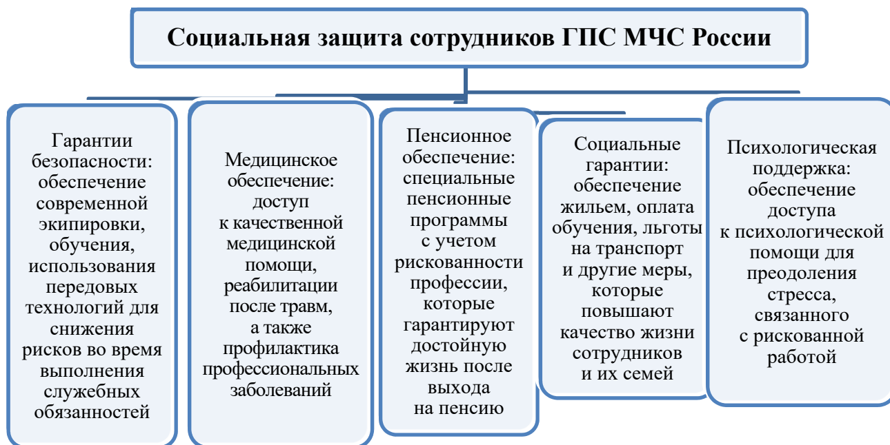
Рис. 1. Социальная защита сотрудников ГПС МЧС России

Социальная защита сотрудников ГПС МЧС России должна включать в себя составляющие, представленные на рис. 1.