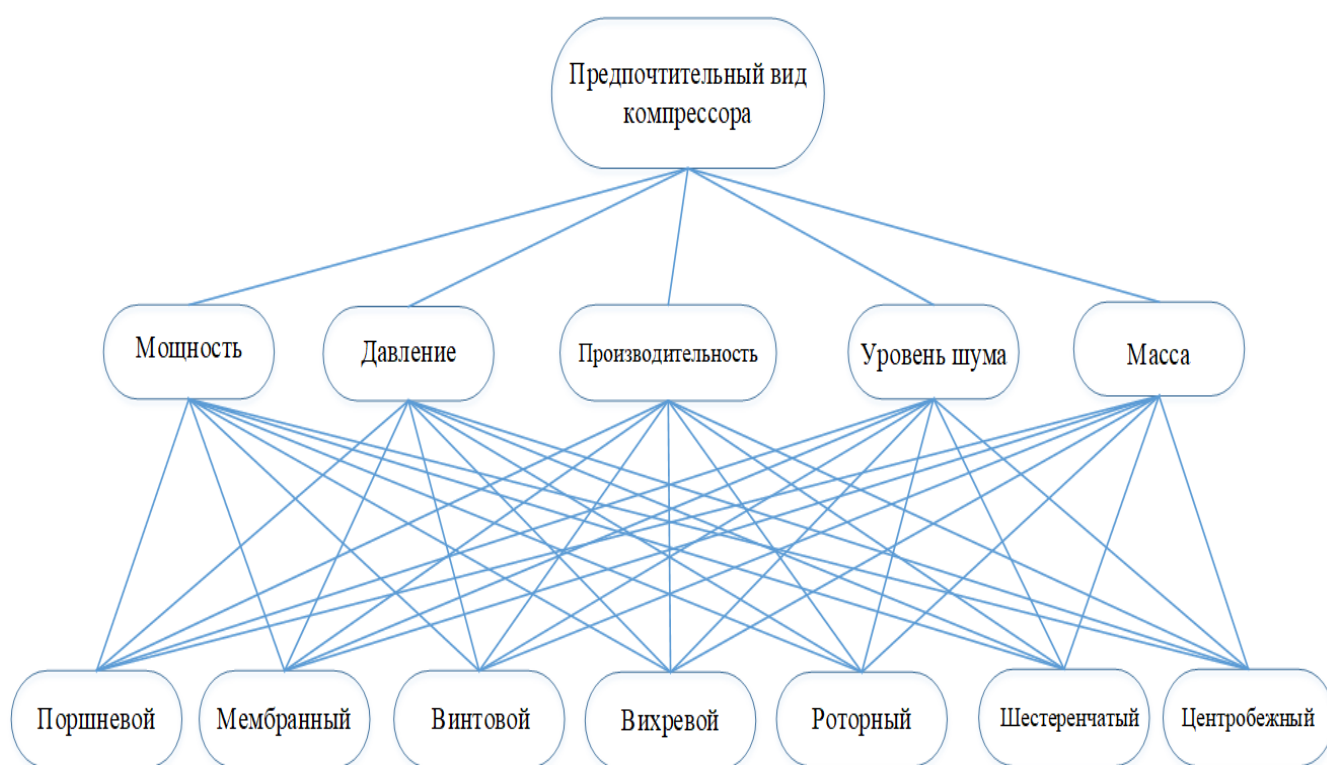
Рис. 2. Иерархическая структура многокритериальной оценки по выбору предпочтительного вида компрессора

Для решения поставленной задачи в соответствии с принятой шкалой группой экспертов внесены данные в разработанные матрицы попарного сравнения [10]. Анализ, обработка и синтез полученных результатов позволяет показать относительное взаимодействие элементов иерархии, выраженное в численном виде, а также определить наиболее предпочтительный вид компрессора.