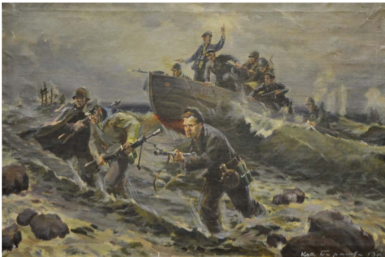
Рис. 5. Баранов В.Г. «Атака», 1959 г. Мурманский областной художественный музей

Невозможно точно утверждать, что изображена высадка десанта в Лиинахамари, но если сравнить эту картину с предыдущей, видна схожесть ландшафта, чувствуется холодное дыхание Арктики, представляем, что десантник на переднем плане – это Георгий Курбатов, бросившийся в бой, чтобы поддержать своих товарищей. Художник прекрасно владеет материалом. Он знаком с ледяной водой Северного моря, с каменистым берегом, с пронизывающим ветром. Василий Григорьевич Баранов закончил в 1937 г. художественное училище в Ленинграде и попал на Северный флот, где служил художником-матросом [5]. Во время Великой Отечественной войны работал художником в Главном политуправлении Северного флота, создавал маскировки от вражеской авиации, выпускал агитплакаты и боевые листки, занимался живописью. Отсюда особая ценность картины «Атака», хранящаяся в Мурманском областном художественном музее. Художник до конца своих дней жил в г. Мурманске, так и не покинув землю, которую защищал в суровые годы войны. Имя Василия Григорьевича Баранова занесено в книгу Почёта Мурманской обл. Он награжден орденом Красного Знамени, орденом Красной Звезды, медалью «За боевые заслуги», медалью «За оборону Советского Заполярья», медалью «За победу над Германией в Великой Отечественной войне 1941–1945 гг.» [6].