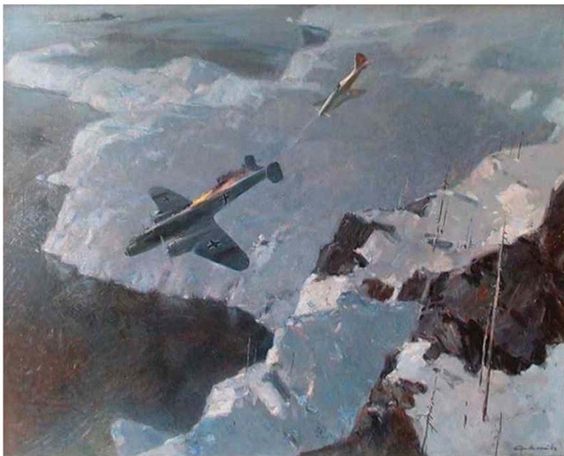
Рис. 1. Нисский Г.Г., 1943 г. «Бой над Баренцевым морем». Ростовский музей изобразительных искусств