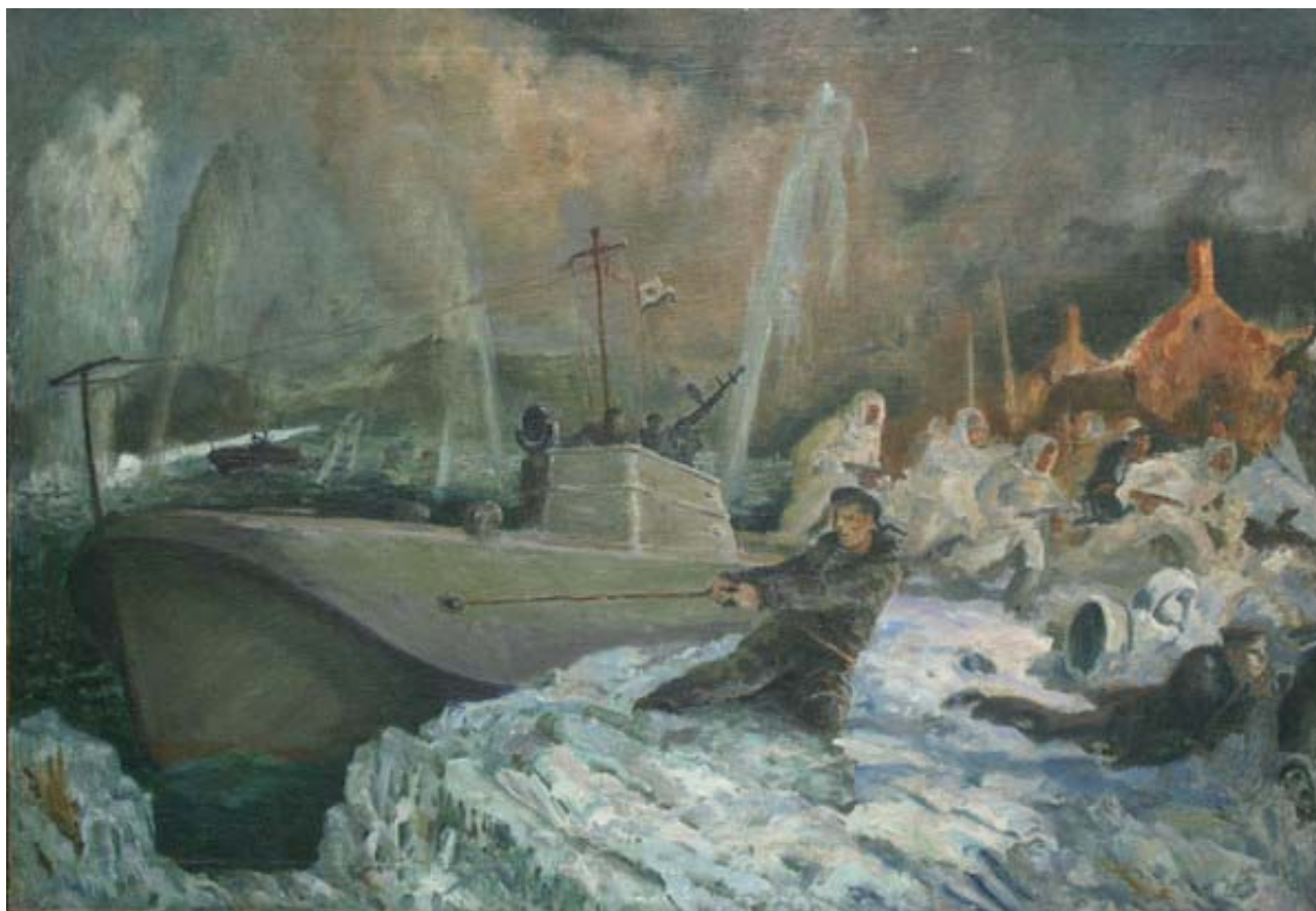
Рис. 4. Андросов К.С. «Подвиг старшины 2-й статьи Северного флота Курбатова», 1944 г. Военно-морской музей имени императора Петра Великого

Художник иллюстрирует героический поступок старшины Курбатова. Ночью 13 октября, преодолев плотный заградительный огонь, катер причалил к берегу. Выскочив из катера, Курбатов не обнаружил ничего, чтобы закрепить швартовочный трос, и тогда он намотал трос на себя, найдя опору, удерживал катер, пока с него не сошел последний десантник. А после этого, раненный в обе руки, сумел отвести поврежденный катер от берега. 5 ноября Георгий Дмитриевич Курбатов был удостоен звания Героя Советского Союза [3].