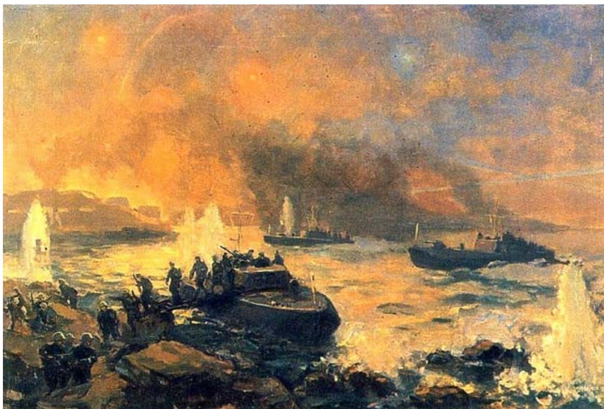
Рис. 2. Горбунов Б.А., 1945 г. «Прорыв торпедных катеров Северного флота в порт Лиинахамари 13 октября 1944 г.». Военно-морской музей имени императора Петра Великого

В Центральном военно-морском музее имени императора Петра Великого находится полотно художника Б.А. Горбунова, датированное 1945 г. Название картины – «Прорыв торпедных катеров Северного флота в порт Лиинахамари 13 октября 1944 г.» (рис. 2).