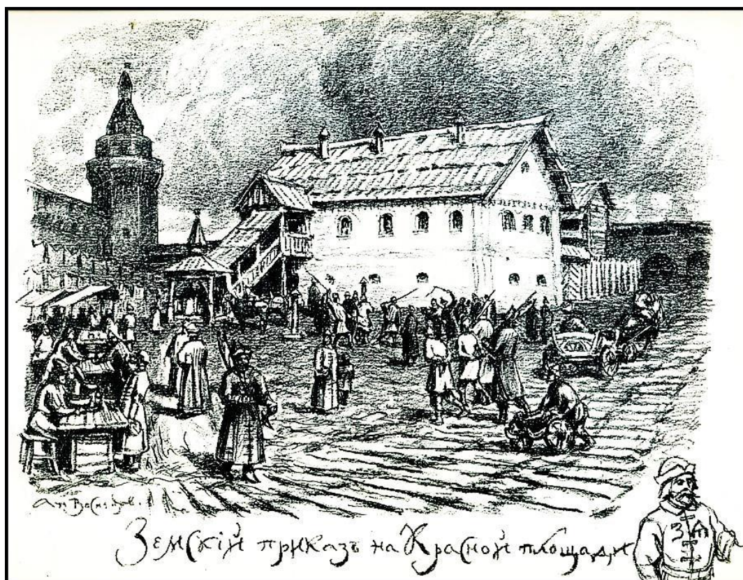
Рис. 1. Земский приказ, где хранились пожарные инструменты

Для конного обоза пожарной станции в Германии были закуплены самые современные по тем временам ручные пожарные насосы, получившие у нас название «заливные пожарные трубы», то есть ручные насосы с коробом. Вода для питания насоса заливалась в этот ящик (короб), и насос при качании коромысла забирал воду непосредственно из короба и подавал ее в закрепленную на насосе трубу 1 , которая могла вращаться и поворачиваться, а из нее вода подавалась в виде компактной струи на расстояние 18–20 м (рис. 2).