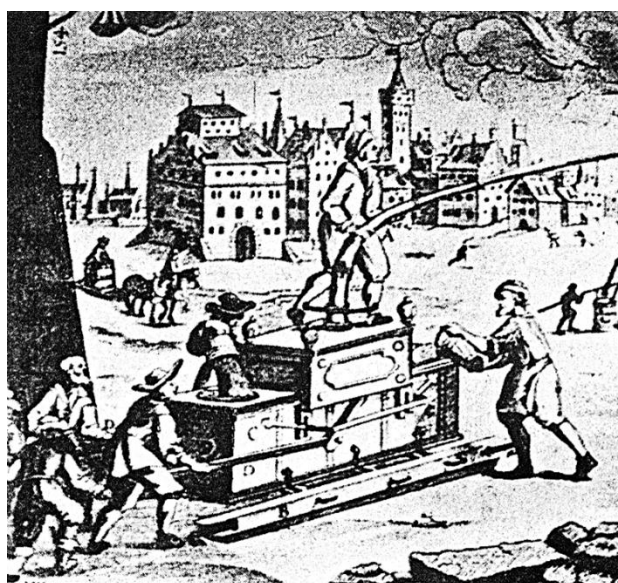
Рис. 2. Заливная труба в работе

Для конного обоза пожарной станции в Германии были закуплены самые современные по тем временам ручные пожарные насосы, получившие у нас название «заливные пожарные трубы», то есть ручные насосы с коробом. Вода для питания насоса заливалась в этот ящик (короб), и насос при качании коромысла забирал воду непосредственно из короба и подавал ее в закрепленную на насосе трубу 1 , которая могла вращаться и поворачиваться, а из нее вода подавалась в виде компактной струи на расстояние 18–20 м (рис. 2).