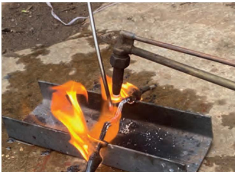
Рис. 3. Эксперимент по моделированию внешнего теплового воздействия пожара

Для анализа образцов использовали комплекс взаимодополняющих методик, адаптированных под специфику каждого типа проводников и соединений: