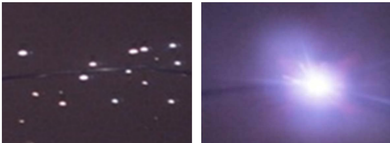
Рис. 1. Эксперимент по моделированию сверхтока и КЗ

– короткое замыкание (КЗ): было смоделировано дуговое короткое замыкание (металлическое КЗ) на разных участках кабельных линий, включая зоны соединений (рис. 1);