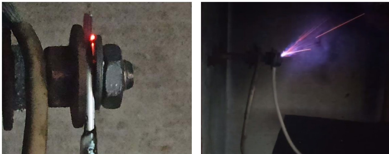
Рис. 2. Эксперимент по моделированию большого переходного сопротивления

– большое переходное сопротивление (БПС): в болтовых соединениях, клеммах и зонах контакта «жила-наконечник» намеренно создавали условия плохого контакта и пропускали через них сверхтоки для моделирования развития электроэрозии (рис. 2);