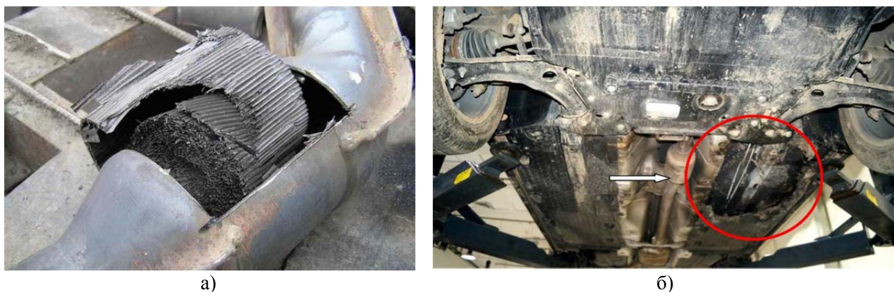
Рис. 2. Визуализация последствий перегрева: а) оплавленный каталитический блок из-за отказа топливной аппаратуры; б) выгорание пластиковой защиты из-за неисправности каталитического блока (адаптировано из [10])

Особую опасность представляет локальный перегрев каталитического блока. При нештатных режимах, например, из-за обогащенной смеси или отказа форсунки, температура в нейтрализаторе может превысить 1 000–1 050 °С, что ведет к оплавлению керамических или металлических сот (рис. 2) и созданию противодавления в выпускном тракте [10]. Последующее повышение температуры может инициировать воспламенение горючих материалов в моторном отсеке. Для ПА, часто работающего в стационарном режиме «насос под давлением», когда естественное охлаждение набегающим потоком воздуха отсутствует, этот риск многократно возрастает, что подтверждается практикой эксплуатации.