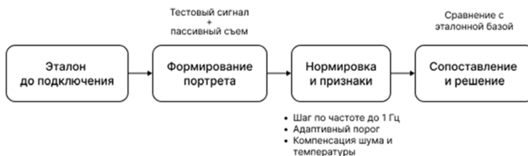
Рис. 1. Порядок работы комплекса идентификации

Последовательность этапов измерительного цикла от фиксации эталона до выдачи решения показана на рис. 1.