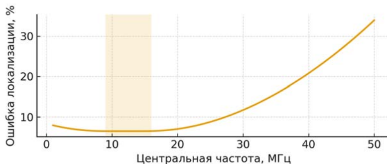
Рис. 2. Ошибка локализации в зависимости от центральной частоты

На рис. 2 показана зависимость ошибки локализации от центральной частоты. Кривая имеет минимум в средней части диапазона и растет на низких и высоких частотах. Эти соотношения учитываются при настройке окна частот.