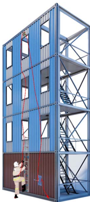
Рис. 1. Системная установка в учебном комплексе

Системная установка в учебном комплексе: несущий узел устройства крепится на стойке/раме на высоте 1 м от «нулевой отметки» подушки безопасности, а отвод верёвки вверх осуществляется через блок, закреплённый над окном 4-го этажа учебной башни (по технологическому описанию). Верёвка стропуется в карабин пожарного пояса обучающегося, далее проходит через верхний блок (ролик) и возвращается к страховочному устройству, где пропускается через канавку и поджимается кулачком (рис. 1). Второй обучающийся (страхующий) обеспечивает постоянную выборку слабины.